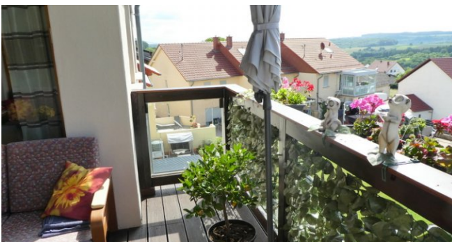
P1010148 - Kopie - Kopie