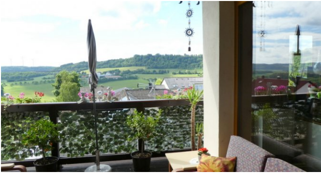
P1010150 - Kopie - Kopie